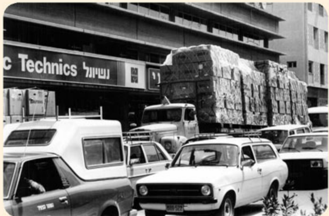
* משאיות עמוסות בסלוליות צבעוניות, לאור הביקוש הגדל להן בעקבות הפחתת מחיריהן לאחר הורדת המיסים

במקום יגאל הורוביץ מונה לכהונת שר האוצר יורם ארידור, שבמקום ה"אין לי" של קודמו דווקא ייזכר כמי שחילק מתנות והיטיב עם הציבור, בשורה של הוזלות מחירים מפתיעות. הופחתו המסים על מכוניות, מכשירי טלוויזיה, מקררים, מכונות כביסה, כלי נגינה, חלקי חילוף לכלי רכב ותכשירים קוסמטיים, ובישראל השתוללה חגיגת קניות. גם הוראתו להפסקת מחיקת הצבע בטלוויזיה גרמה לרכישת מאות אלפי מכשירים צבעוניים.