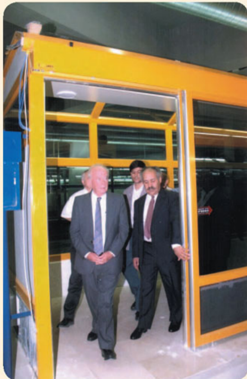
* ראש הממשלה יצחק רבין ומרדכי יונה בפתחה של התחנה המרכזית החדשה בתל-אביב, אוגוסט 1993

ב-18 באוגוסט 1993 נחנכה בתל-אביב התחנה המרכזית החדשה והמשוכללת, לאחר 26 שנות בנייה! מחירה: חצי מיליארד ₪.