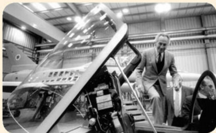
* ראש המחשלה דאג, שמעון פרס, צועד לעבר תא הטייס של מטוס הקרב הלבאי, 1985

ויכוחים אין-סופיים ולחצים קשים מצד ארה"ב להפסיק את הפרויקט ואף לפצות את ישראל בגין הוצאותיה הגדולות לייצור מטוס הקרב המשוכלל, הביאו בסופו של דבר ב-30 באוגוסט 1987, ברוב זעום של 12 נגד 11 שרים, להחלטת הממשלה להפסיק את הפרויקט. אלפים מעובדי התעשייה האווירית התפרעו וחסמו כבישים רבים. 4,000 עובדים אכן פוטרו לאחר הפסקת ייצור המטוס. בכך בא לסיומו חלום ייצור מטוס הקרב הישראלי, שהיה כבר בן חמש שנים. הנימוק, כי אין בפרויקט שום היגיון כלכלי – הוא שהכריע בסופו של דבר והביא להפסקת הפרויקט היוקרתי. בראש המצדדים בהמשך הפרויקט – לאחר שמטוס לבאי כבר המריא לטיסת ניסיון – היה השר משה ארנס, שהתפטר מהממשלה בעקבות ביטול הפרויקט. בראש מחנה המתנגדים לייצור הלבאי עמד שר הביטחון יצחק רבין. הפיצוי האמריקני לישראל על הפסקת הפרויקט היקר: אספקת 150 מטוסי אף-16 לישראל.