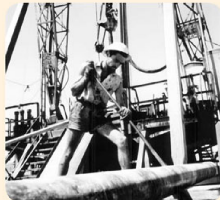
* אחד העובדים בשדה הנפט "חלץ" שבנעלות חנרת לפיחית

ב-23 בספטמבר 1955 התגלה בישראל לראשונה נפט בכמויות מסחריות בקידוח חלץ 1 בשדה שבצפון הנגב. המדינה רעשה ושמחה מהתגלית, ועד מהרה נוצרו פקקי תנועה באזור חלץ, שכן אלפי ישראלים באו לראות במו עיניהם את הנס שאירע, ואף הצטלמו למזכרת כשהם שוכבים או יושבים על החול השחור מהנפט שפרץ.