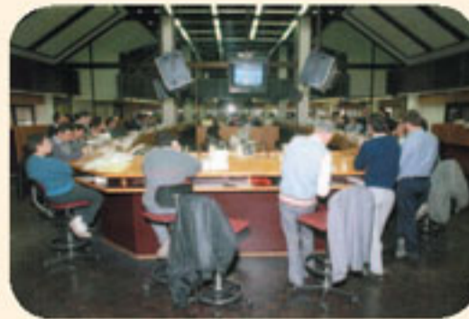
* מבט כללי על אולם הבורסה לניירות ערך בתל-אביב

מס הבורסה הראשון, שבוטל כעבור מספר שנים, הופעל על-ידי שר האוצר האגדי, פנחס ספיר, ב-7 ביוני 1964. הטלת מס על רווחי הון בבורסה חודשה רק לאחר שנים רבות, ב-2003.