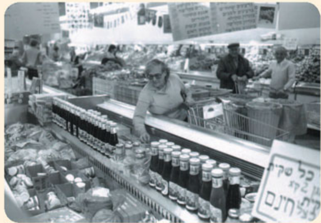
* השוואת מחירים בסופרמרקט ביחשלים ביום שלאחר "עסקת החבילה" במשק

ב-4 באוקטובר 1983 חשף העיתון ידיעות אחרונות, באחד הסקופים הגדולים בתולדות המדינה, את תוכניתו של שר האוצר יורם ארידור לבצע מהלך של דולריזציה של השקל הישראלי – למעשה, הפיכת הדולר להילך חוקי בישראל. שר האוצר נאלץ להתפטר, עם חשיפת התכנית, ובמקומו מונה לשר האוצר יגאל כהן-אורגד.