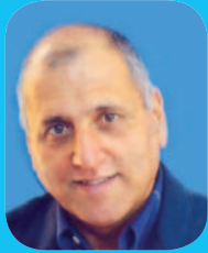
אהרון כהן נשיא התאחדות הקבלנים והבונים בישראל

לפעילות בחו"ל ועוד. בעיה נוספת עימה מתמודד הענף הנה העלייה במחירי תשומות הבנייה כמו ברזל, מלט, ביטומן ועוד, וזאת ללא מנגנון פיצוי על עליות המחירים.