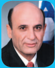
שאול חופז שר הביטחון

למדינה והובלתו כנגד כל הסיכויים לניצחון במלחמת העצמאות; (ב) פתיחת שערי הארץ לעלייה המונית בניגוד לרוב חוות הדעת והמלצות המומחים הכלכליים שטענו שהמדינה הצעירה תקרוס תחת הנטל; (ג) הקמת צה"ל כצבא ממלכתי אחד תחת מרות בלעדית של ממשלת ישראל.